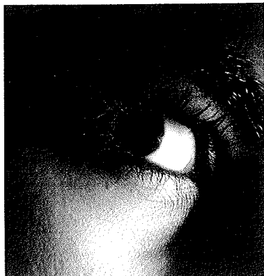
Følelsen er afmagt kan presse personalet ud i uheldige situationer

Den mest primitive forsvarsmekanisme er omnipotensen , hvor vi forsøger at bilde os selv ind, at vi er højt hævet over risikoen for forrælse. Omnipotente tanker kunne være ”sådan kunne jeg aldrig få det” eller ”jeg ville stoppe i tide”.