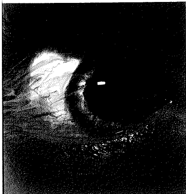
Mennesket har mange forsvarsmekanismer, der skal fortrænge ondskaben.

mer, "konsekvenspædagogik" der betyder straf eller "grænsesætning" der betyder ydmygelser og vold.